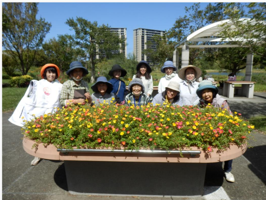
アイランドシティ中央公園・園芸福祉の庭にて