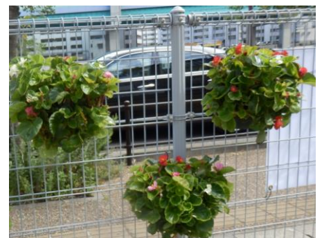
来校者を楽しませてくれる ウエルカム・ハンギングバスケット