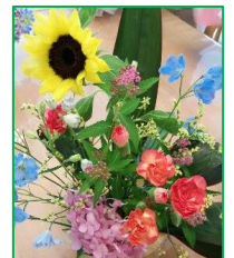
私流のフラワーアレンジメント (ヒマワリの花をプレゼント)