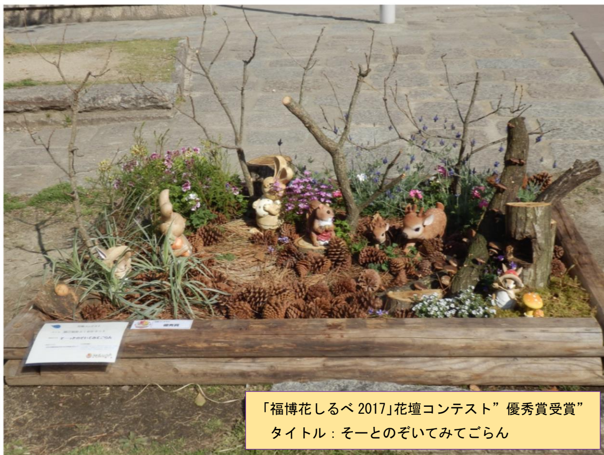
「福博花しるべ2017」花壇コンテスト”優秀賞受賞” タイトル：そーとのぞいてみてごらん