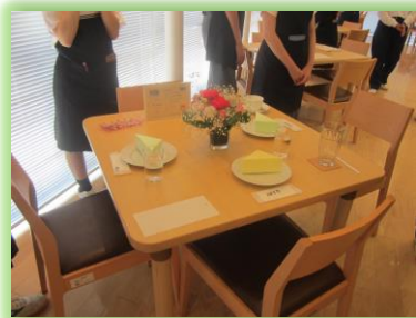
カフェに飾られた作品

2回目の授業は、6月14日(水)先生の希望でフラワーアレンジメント体験をしました。あらかじめ準備したデザインの異なる2個のサンプルを生徒に示して、作りたいと思う方を選んでもらいました。ガラスの花器にヒマワリ、カーネーション、トルコキキョウ、バラ、カスミソウ、ドラセナなどを使って作品を作ります。フラワーアレンジメントづくり体験は初めてとのことなので、切り方や挿し方など基本的な部分をていねいに伝え、ハサミで指を傷つけることの無いように注意し、一つ一つの作業を確認しながら進め、皆さんきれいに仕上げる事が出来ました。終わってから「楽しかったー」と笑顔でした。完成作品は学園のカフェに飾られました。