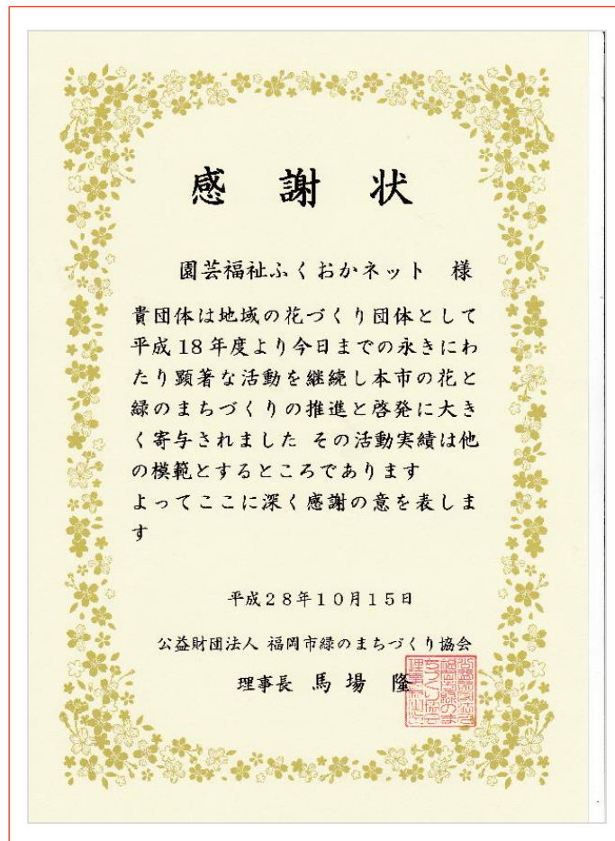
福岡市都市緑化推進行事グリップキャンペーン 2016 に於いて頂いた感謝状です。