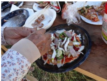
お好みでトッピング

石釜の火入れを兼ね10月2日試し焼きをしました。手軽な冷凍生地を使うのもありますが、ここは「少し手間をかけよう!」と強力粉と薄力粉を混ぜて生地作りからこだわりました。1時間程ねかせ発酵させたピザ生地にお好みでピーマン、トマト、玉ねぎ、ウインナー、チーズ等をトッピング。この日、参加してくれたお嬢さんは「ハーブガーデンで初めての体験を沢山して、今日は楽しかったあ!」と帰路の車中、夕食でも会話が弾んだと感謝されました。後日舞鶴公園のグリッピーキャンペーンの私たちのブースに差し入れを持って駆けつけてくださいました。こんなふうに感謝され、人との輪が広がるから楽しくてボランティアは止められないですね。