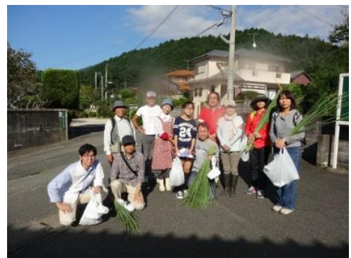
レモングラスをお土産に帰路へ