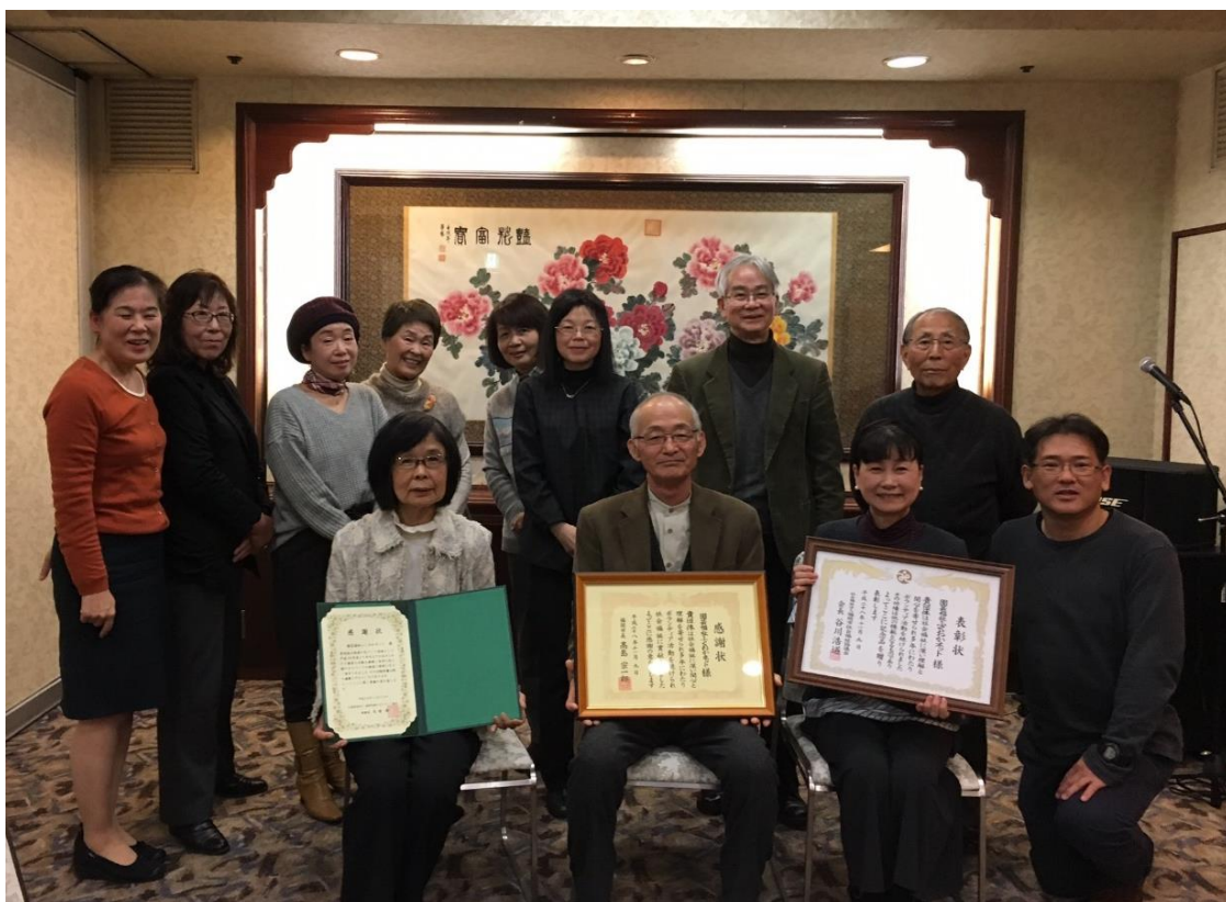
受賞祝賀会 永年の花と緑のまちづくり活動、社会福祉に理解と貢献した功績で受賞