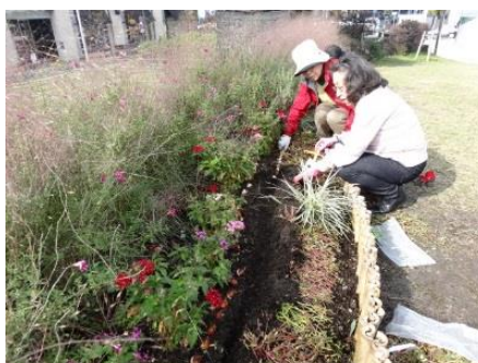
「花しるべ2017」に向け、チューリップの球根を植えました。