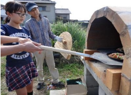
ビールにのせて石釜の中へ

休耕田(300坪)を活用して「地域のコミュニティー・ガーデンを作りたい」と活動をはじめて3年目。やっとピザ釜が夏に完成しました!