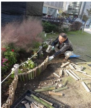
土留めの竹組に苦戦中!

警固公園ライトアップ期間/2016年11月10日(木)~2017年1月9日(月) 17:00~24:00