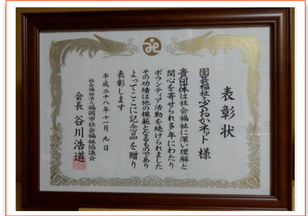
平成 28 年度福岡市福祉のまちづくり推進大会で頂いた感謝状と表彰状です。