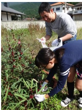
沢山実ったローゼルの収穫体験

宇美町の「風かおるハーブガーデン」は樹木や花、ハーブ(約40種類)などを楽しむことができます。苦戦しながら汗水たらして(笑)、ガーデン作りやピザ作り(不定期)を楽しみ、仲間とわいわいハーブ談義に花を咲かせています。「たのしむ心」を持参でだれでも、いつでも、気軽に遊びに来てくださ〜い。スタッフ一同大歓迎します!