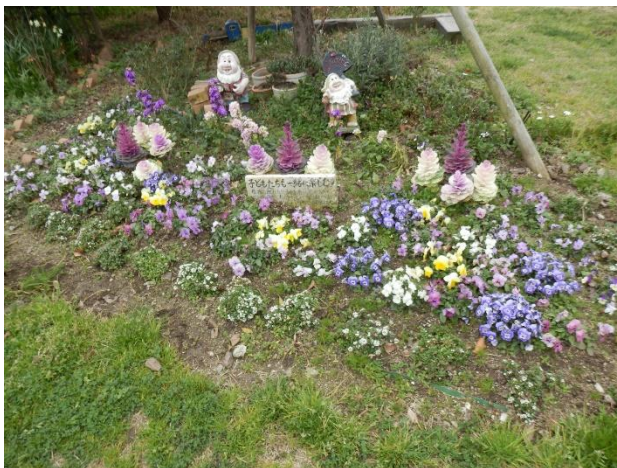
テーマ花壇も各々特徴が表れてきれい！