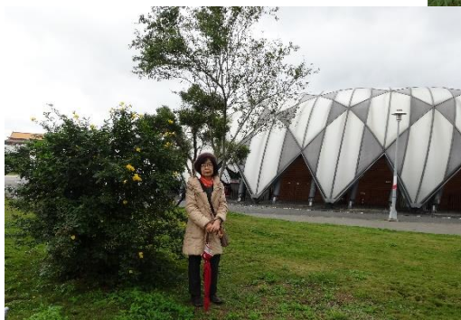
育った樹木と私:国際花卉博覧会跡地にて