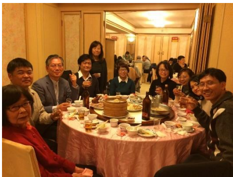
東京農業大学卒業生と私(左)