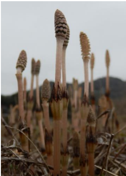
田んぼの畦 あぜ で春をみつけた