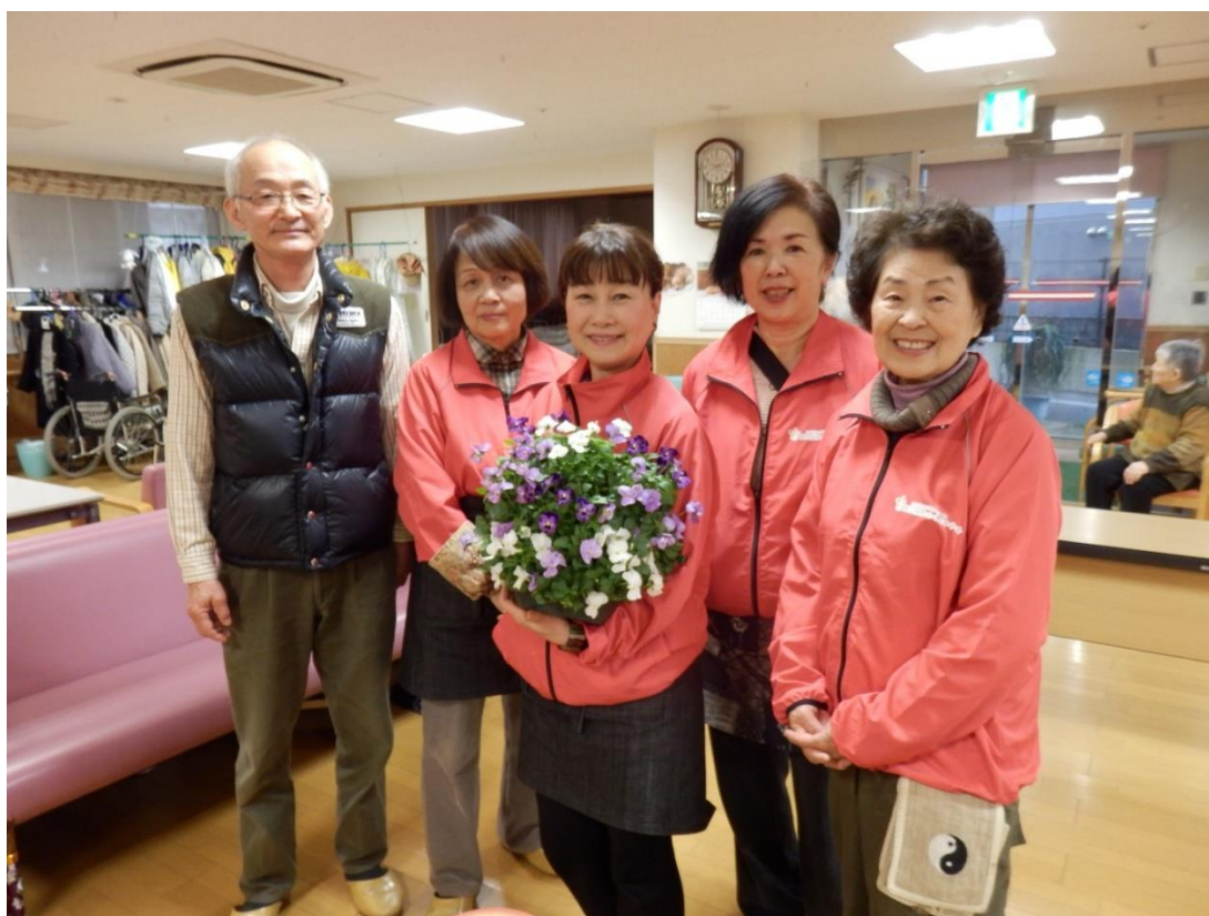
<福祉園芸体験事業 2月2日のスタッフ 博多区福祉施設にて>