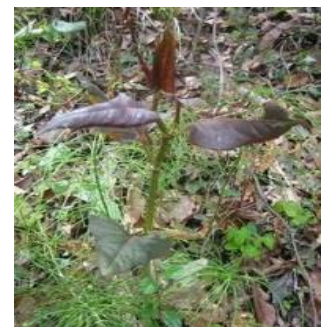
すかんぼ(イタドリ)