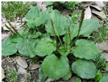
かえるっぱ(オオバコ)

調査の結果ですが、全47種のうち気化植物が20種ありました。繁茂特性は多年生や越年生が23種と環境変化が生態系に及んでいるようです。雑草されど雑草、上手く共存していきましょう。