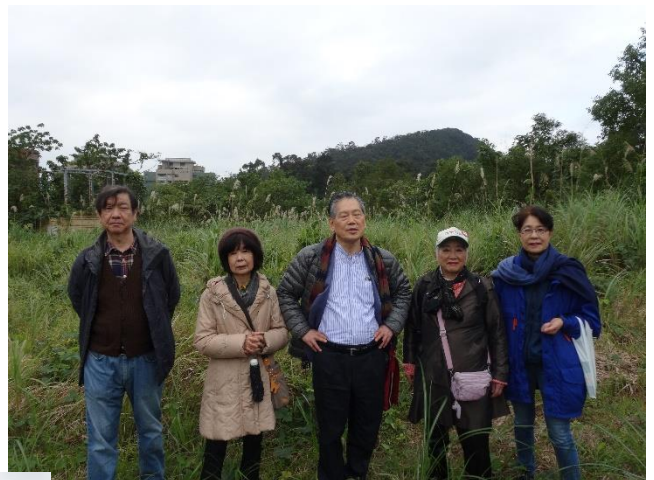
園芸福祉の庭予定地を視察