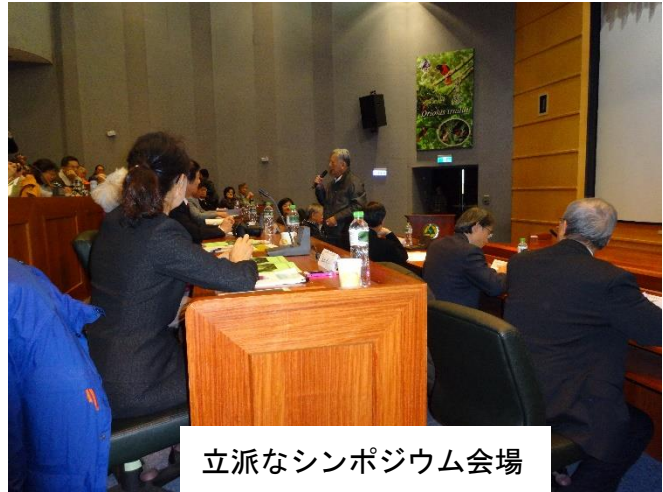
立派なシンポジウム会場