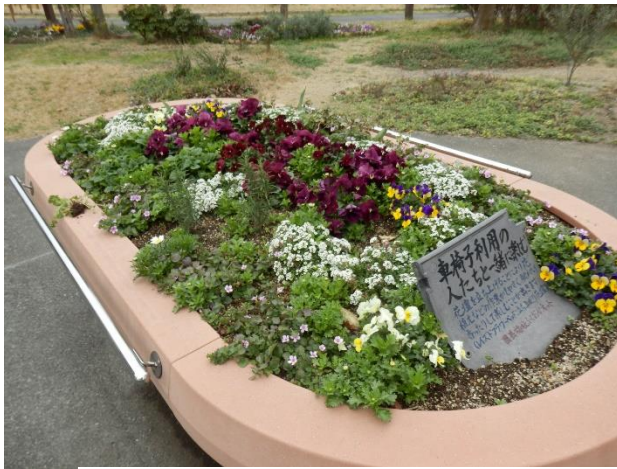
車いす利用の人たちと一緒に楽しめる花壇