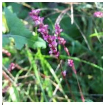
赤まんま(イヌダテ)