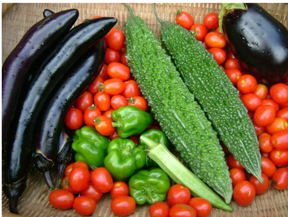
(大地の恵み～夏の野菜たち)