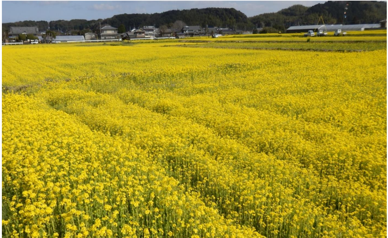
<福岡県古賀市の菜の花畑>